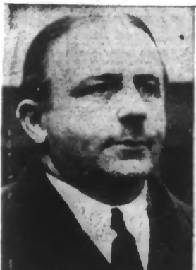
M. Roger SALENGRO (Soc.)