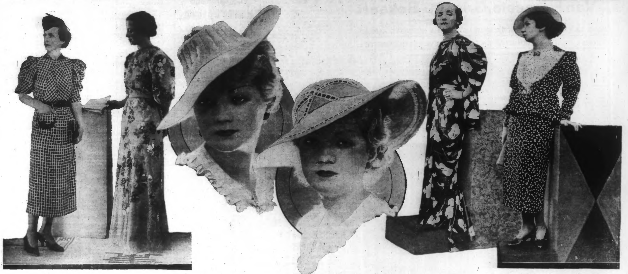
De gauche à droite : Robe à carreaux noir et blanc, garnie de crêpe noir. — Robe du soir, fleurs sur tulle. — Capeline manille, garnie de fruits. — Capeline paille, entre-deux ajouré. — Ensemble soie laquée noir et blanc. — Tailleur noir et blanc, blouse et revers de soie

PHOSPHATINE - de qualité constante - très facile à préparer - dépense journalière insignifiante LA PREMIERE FARINE DE BEBE