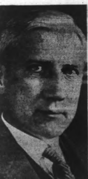
M. VON BULOW Berlin, 21. — M. Bernard von Bulow, secrétaire d'Etat aux Affaires étrangères est décédé ce matin à la suite d'une pneumonie.