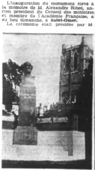
Le Monument élevé à SAINT-OMER, à la mémoire de M. Alexandre RIBOT et qui a été inauguré hier.

M. Jeanneney, Président du Sénat, a présidé hier, dimanche, cette cérémonie