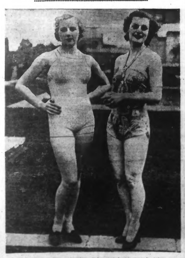
Voici deux costumes de plage qui seront lancés pour la saison. Lire en 8 e page : NOTRE PAGE FÉMININE