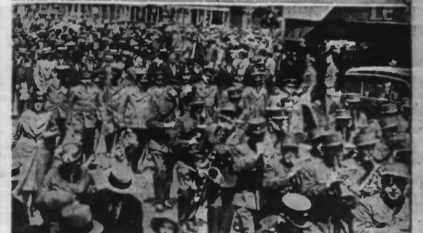
EN HAUT : La Municipalité Lilloise passant en revue, les Sociétés de Jeunes Populaires, Boulevard des Ecoles. EN BAS : Le défilé des Sociétés de Musique, l'après-midi, Rue de Paris.

Les traditionnelles « Fêtes de Lille » de la fin de juin ont groupé cette année sous cette unique étiquette, les populaires fêtes des « Sociétés de Jeunes Populaires », celles du « Secteur Lillois des quartiers de Saint-Sauveur, Saint-Maurice, Saint-Étienne », et celles enfin de la « Fédération des Sociétés Musicales du Nord et du Pas-de-Calais ».