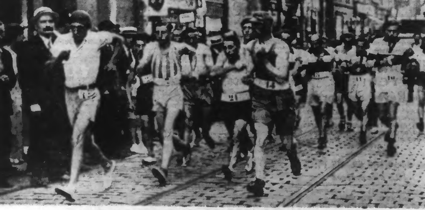
Le départ des concurrents, rue de Paris, face à notre journal.

LA CHALEUR ET UN PARCOURS DIFFICILE OCCASIONNÈRENT DE NOMBREUX ABANDONS