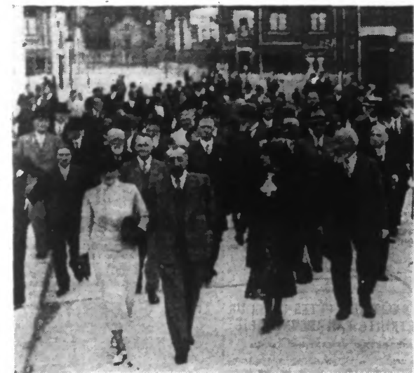
Les Congressistes visitant, hier, un groupe d'habitations à bon marché.

M. HENRI SELLIER, MINISTRE DE LA SANTÉ PUBLIQUE A, HIER ENCORE, PRÉSIDÉ AUX DÉBATS ET AUX EXCURSIONS DANS LA RÉGION DE LILLE - ROUBAIX - TOURCOING