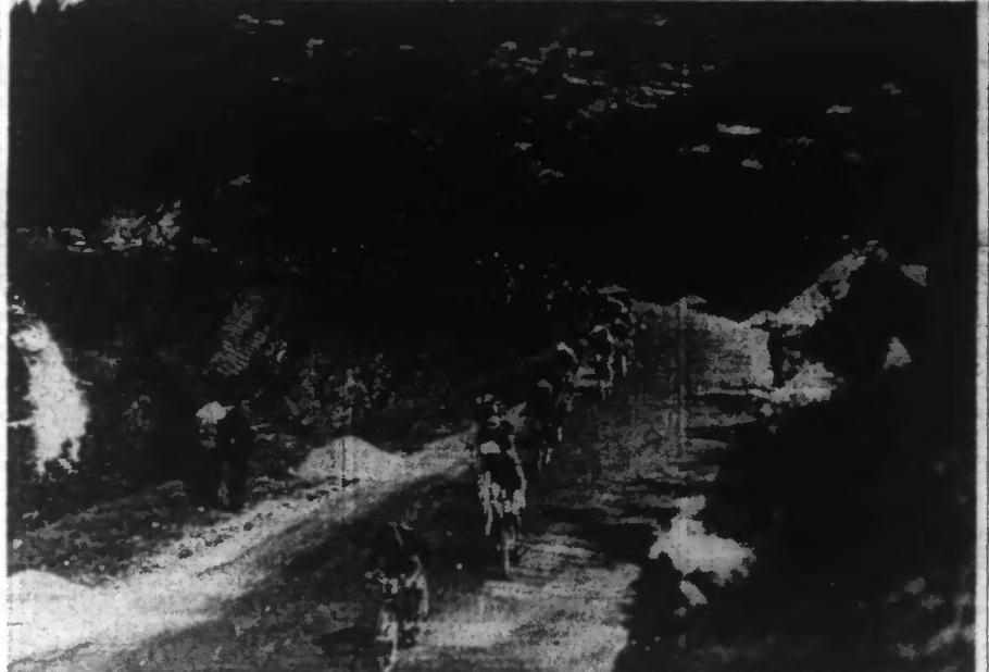
Première difficulté !... Le peloton va entreprendre la montée de la côte SAINT-HIPPOLYTE.