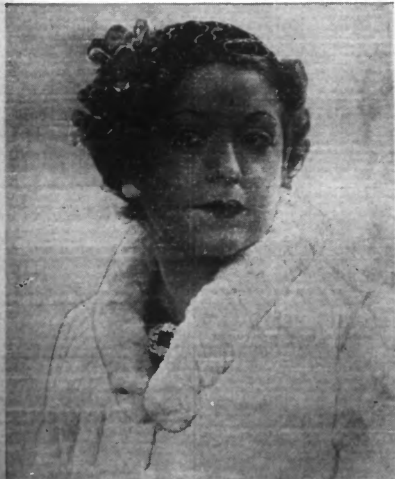
Pour le soir : BONNICHON noir fleurs et fils or. (Photo Henri Manuel).