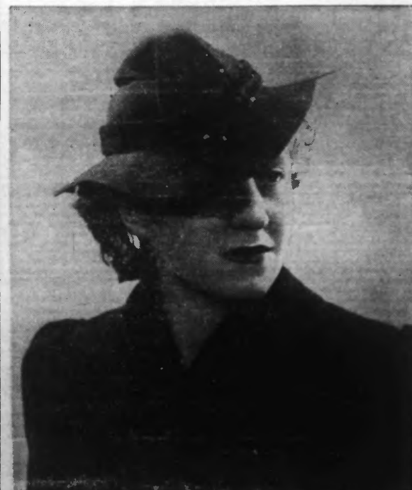
CLOCHE sport marine cordelière rouge. (Photo Henri Manuel).

Pour nettoyer vos lainages, mettez dans un nouet une poignée de cendres de bois ; laissez tremper pendant un quart d'heure dans de l'eau bouillante. Ajoutez la même quantité d'eau froide ; plongez-y le lainage. Nettoyez au savon de Marseille, sans oublier que la quantité du savon a une grande importance. Rincez à plusieurs eaux tièdes.