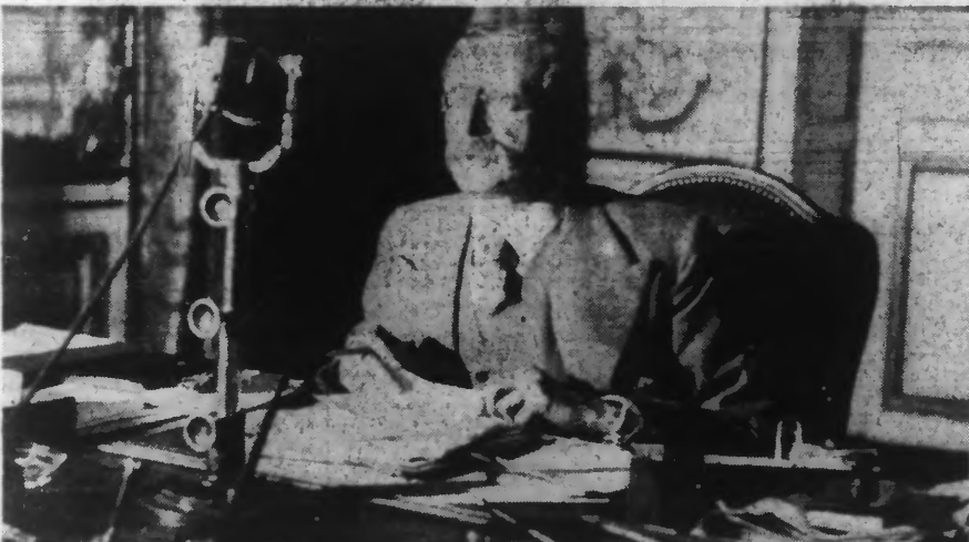
M. LEON BLUM PARLANT AU MICRO.

« Après de l'alternative de la Guerre et de la Paix, aucun intérêt humain ne compte... » « Sur le plan intérieur, nous ne pouvons avoir d'autres adversaires que ceux de l'intérêt collectif de la France... » « Concorde entre les citoyens, c'est ainsi que le plus grand de nos poètes a défini la Patrie... »