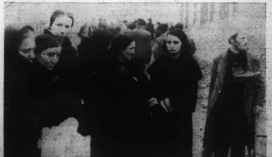
Dans l'amas de débris, les habitants de MADRID recherchent les objets qui leur ont appartenu

« NOUS NOUS REFUSONS A TOUTE MÉDIATION », A DÉCLARÉ LE GÉNÉRAL FRANCO