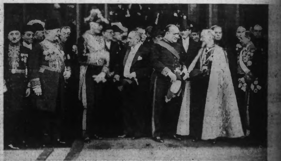
Les membres du corps diplomatique sortant de l'Elysée. A droite : le Nonce du Pape parlant avec l'Ambassadeur de Pologne.

Paris, 31. — Le Président de la République assisté de MM. Delbos et Viollet a reçu les membres du corps diplomatique qui sont venus lui apporter leurs vœux à l'occasion de la nouvelle année. Le doyen, Mgr Valeri, nonce du Siège, a prononcé une allocution. Il a dit que, malgré de sombres présages, il conservait l'espoir de voir se lever le jour tant désiré de la paix promise aux hommes de bonne volonté. Il énuméra les événements prochains permettant d'en-