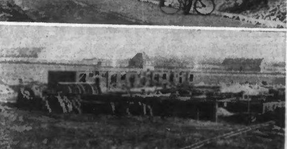
EN HAUT : Les travaux de déviation de la Route conduisant à la Gare Centrale au cimetière de CALAIS-NORD, devant les chantiers de la caserne de gardes mobiles dont on voit un aspect partiel EN BAS.