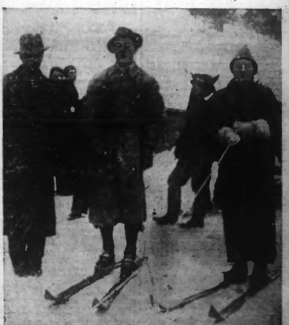
Les nouveaux époux passent leur lune de miel incognito à KRYNICA, en Pologne où ils pratiquent les sports d'hiver. Avant de faire une promenade en skijoring, les nouveaux époux se laissent complètement photographier.