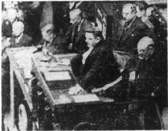
M. HERRIOT prononçant son discours de rentrée.

Paris, 14. — La séance de la Chambre est ouverte à 15 h. 40, sous la présidence du président nouvellement réélu, M. Edouard HERRIOT, devant un grand nombre de députés. Le président du Conseil, avant de s'asseoir à côté de ses collaborateurs, était allé s'entretenir avec le président de la Chambre à son fauteuil. M. Edouard HERRIOT prononce son allocution.