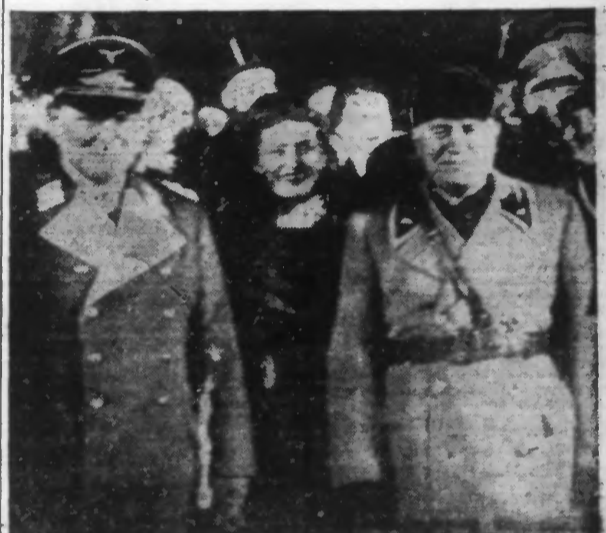
Voici à l'arrivée du Général GOERING à ROME, de gauche à droite : le Général GOERING, la Comtesse CIANO et M. MUSSOLINI. (Transmis par télégramme de Rome à Paris).

...MAIS IL SE CONFIRME QUE LES CONVERSATIONS ACTUELLES ONT POUR OBJET DE TRACER LA LIGNE DE CONDUITE ITALO-ALLEMANDE A L'ÉGARD DES AFFAIRES D'ESPAGNE. :: ::