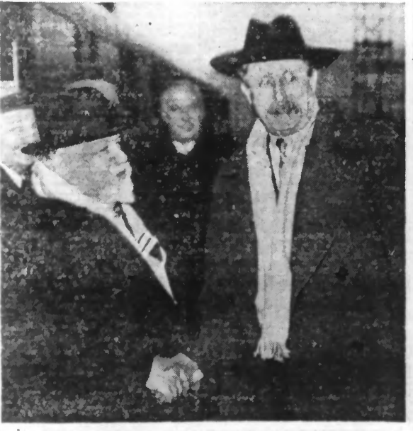
M. Léon BLUM, accueilli hier matin à la Gare de Lyon par M. BEDOUCHE, Ministre des Travaux Publics, est rentré à Paris pour assister au Conseil des Ministres.

IL A APPRUVÉ LE PROJET DE LOI RELATIF A L'INTERDICTION DU RECRUTEMENT DES VOLONTAIRES POUR L'ESPAGNE, AINSI QUE SEPT DÉCRETS PORTANT EXPROPRIATION D'USINES D'AVIATION ET S'EST OCCUPÉ DE L'APPLICATION DE LA SEMAINE DE QUARANTE HEURES