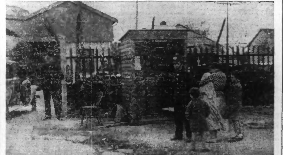
Les derniers événements en Espagne et au Maroc espagnol ont mis au premier plan le port fortifié anglais de Gibraltar. La garnison en a été renforcée, les fortifications également. Comme on le voit ci-dessus, la seule entrée du territoire de Gibraltar restée ouverte, est gardée par des factionnaires.

Une colonne de rebelles, attaquée par surprise sur le front de Madrid, a dû se replier