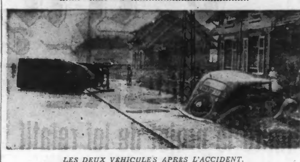
LES DEUX VEHICULES APRES L'ACCIDENT.