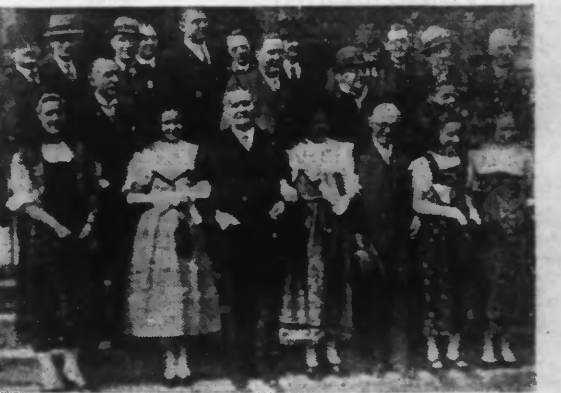
Les délégations et les Alsaciennes en costume local au cours de la visite de ROUBAIX.

IL FUT PRÉCÉDÉ, DANS LA JOURNÉE, D'UN BANQUET QUE PRÉSIDA M. LEBAS, MINISTRE DU TRAVAIL