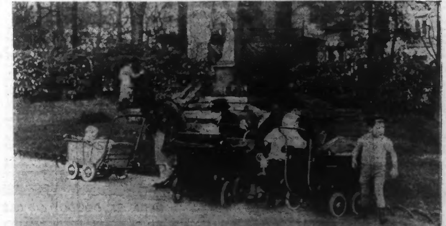
VEILLE DE PRINTEMPS AU JARDIN VAUBAN, A LILLE.