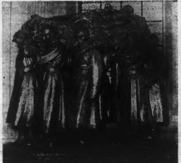
LE MAUSOLEE DU MARECHAL FOCH AUX INVALIDES.

Paris, 20. — Il y a 8 ans, le maréchal Foch mourait. En ce jour anniversaire son corps qui reposait jusqu'alors dans le tombeau des gouverneurs des Invalides est transféré dans un tombeau définitif, sous le dôme où repose Napoléon. C'est dans une chapelle latérale, à droite du tombeau de l'empereur, chapelle qui est dédiée à Saint-Ambroise, que le tombeau du maréchal Foch est édifié. Le vainqueur de la guerre reposera à jamais près de compagnons dont la gloire ne fut pas éphémère : Turenne, Jourdan, Duroc, Bertrand, etc. Son tombeau est tout proche des urnes où sont conservés le cœur de Vauban, celui