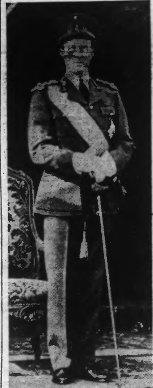
A l'occasion de la fête patronale du défunt Roi ALBERT, la garnison de BRUXELLES a défilé devant le Roi LEOPOLD. Dans la tribune d'honneur, le Roi LEOPOLD assiste au défilé.

Une grande revue a eu lieu à Bruxelles à cette occasion