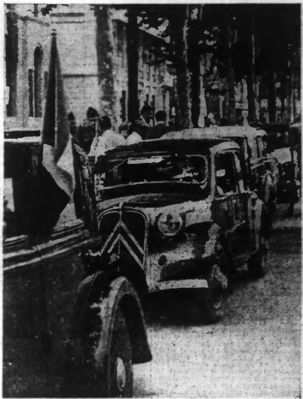
Les voitures de ressortissants français rangées devant le Consulat de BARCELONE sous la protection de fanions français et de Gardes Nationaux Républicains.

DANS LE SECTEUR DE BERMÉO, LES ITALIENS SE TROUVENT CERNÉS DANS UN AMPHITHÉÂTRE DE MONTAGNES