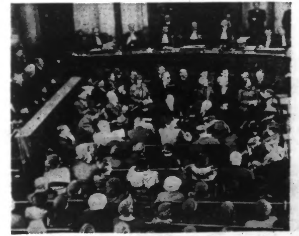
Une vue de la salle de la Cour d'Assises de DOUAI pendant les débats d'un procès.

ment se terminera par un acquittement. » Sans commentaires. Les débats La salle était pleine à craquer lorsqu'on appela cette affaire De Font-Mareq, de Tourmignies, d'Attiehes, d'Artenay, de Merignies, de toute la Pévèle, on avait tenu à assister aux débats du meurtre du garde-chasse. Sur la route de Douai, j'avais été, dès le matin du 12 Novembre, une longue file de voitures, de charriots emmenant toute cette foule qui s'en allait persua-