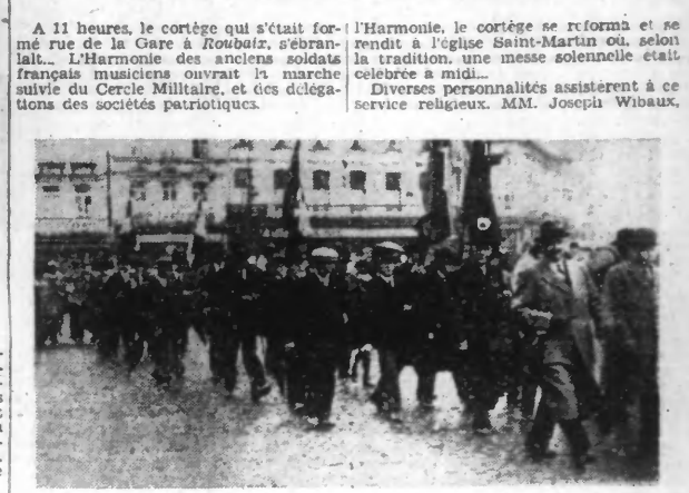
Le cortège traversant la Grand Place.