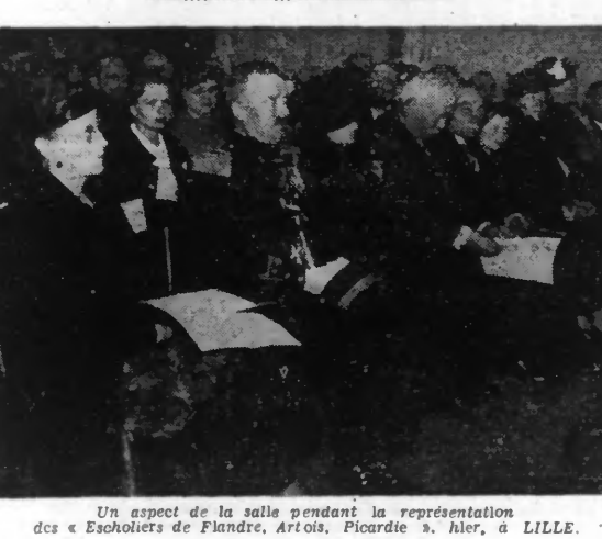
Un aspect de la salle pendant la représentation des « Escholiers de Flandre, Artois, Picardie », hier, à Lille.

Les « Escholiers de Flandre, Artois, Picardie », une brillante cause, ont été présentés à la Faculté des Lettres de Lille pour l'interprétation d'œuvres de moyen-âge, a donné, hier après-midi, sa première représentation dans la salle des fêtes de l'Université.