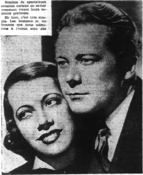
GENE Raymond et Lily PONS, dans leur dernier film musical « THAT GIRL FROM PARIS ».

Nombre de spectateurs seraient curieux de savoir comment vivent leurs vedettes préférées. En bien, c'est très simple. Les hommes et les femmes que nous admirons à l'écran sont des