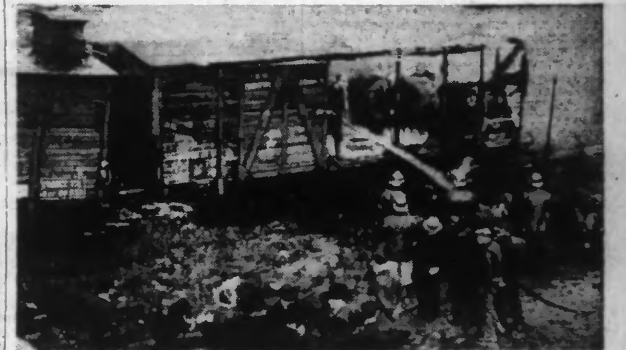
Les pompiers s'appliquant à réduire les dégâts de l'incendie du wagon en Gare de FIVES-LILLE.

LES CADAVRES ONT ÉTÉ DÉCOUVERTS DANS LES DÉCOMBRES PAR LES POMPIERS APPELÉS POUR COMBATTRE LE SINISTRE