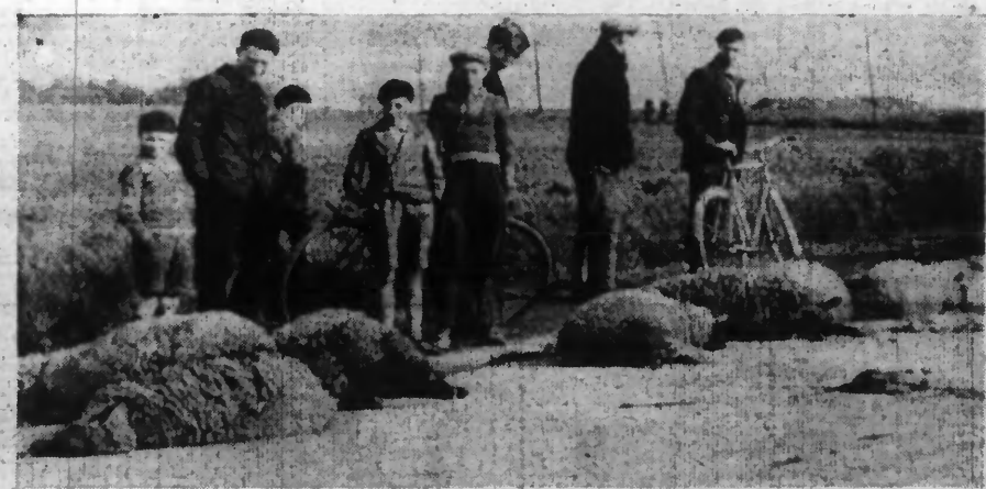
LES MOUTONS ÉCRASÉS SUR LA ROUTE.

...UN LOURD CAMION PASSA ET LAISSA DERRIÈRE LUI SEPT CADAVRES