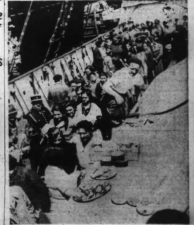
Le paquebot anglais « Maritz » est arrivé à Pauillac. Il se trouvait à bord 300 réfugiés espagnols venant de Bilbao. Notre photo montre à leur arrivée, avant le débarquement, les réfugiés qui n'avaient rien mangé depuis deux jours et qui sont restaurés.

LA CAUSE DE L'ACCIDENT EST EXTÉRIEURE AU NAVIRE ET ON CROIT QU'IL S'AGIT D'UNE MINE SOUS-MARINE