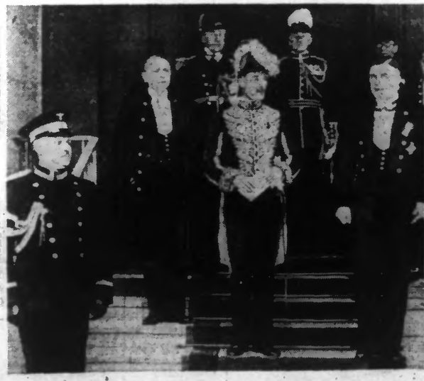
Ainsi que nous l'avons annoncé, Sir NEVILLE HENDERSON, le nouvel Ambassadeur de Grande-Bretagne à Berlin, a présenté ses lettres de créance au Chancelier HITLER.