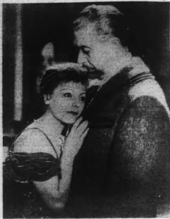
Gaby MORLAY et Victor FRANÇEN, dans une scène du film. Voir, par ailleurs, le compte-rendu de la présentation.