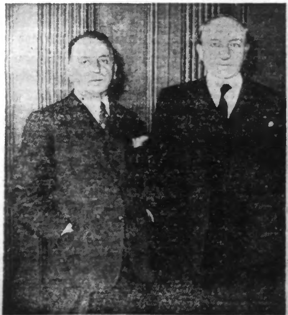
M. Yvon DELBOS, Ministre des Affaires étrangères, a reçu ce matin, de 10 h. 10 à 10 h. 30, M. ANTONESCO, Ministre des Affaires étrangères de ROUMANIE. Les voici tous les deux photographiés à l'issue de leur entretien.