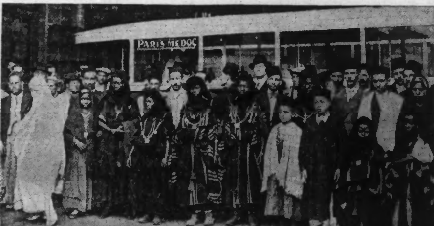
Les Maures et les Mousques en costumes indigènes à leur arrivée à la Gare de Lyon, venant de la région d'EL OUELA.

DES INDIGÈNES DE L'AFRIQUE DU NORD SONT ARRIVÉS A PARIS POUR HABITER LES PAVILLONS ALGÉRIENS ET MAROCAINS