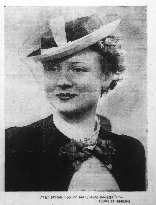
Petit breton noir et blanc avec poilette.