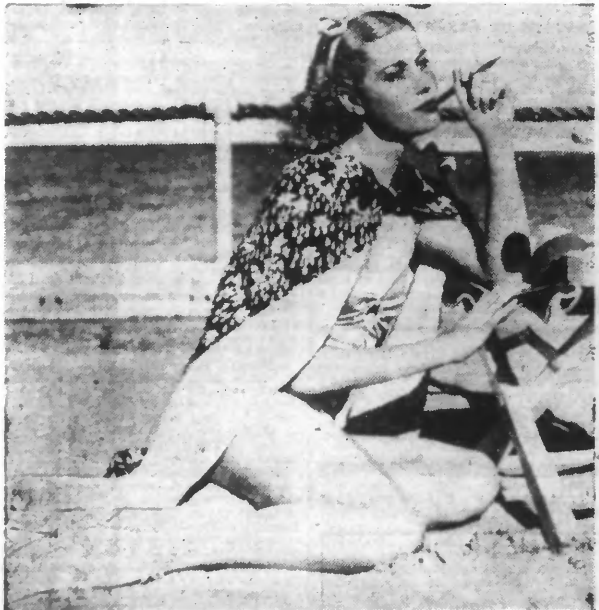
Les océans ont toujours inspiré les poètes ou les romanciers, devant l'étendue illimitée, chacun trouve le moyen de traduire en mots les pensées qu'il ressent. Ainsi, l'actrice de cinéma, ANITA LOUISE, se délasse de son labeur quotidien en essayant de rimes, au bruit de la mer...

Dans quelques jours, nous offrirons à nos lectrices et à nos lecteurs un poignant roman d'amour qui pose une question troublante: une épouse dont le mari est infidèle peut-elle, par représailles, le tromper à son tour? Sujet palpitant que traite, avec une maîtrise remarquable, le célèbre romancier DANIEL IESUEUR, dans cette œuvre magnifique qu'est: