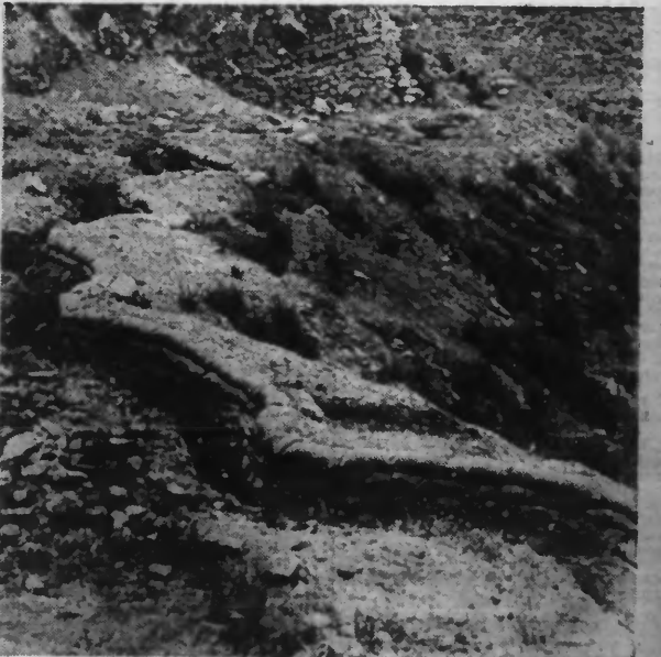
Une tranchée qui vient d'être abandonnée sur le front d'ARAGON.

UN GRAND DUEL D'ARTILLERIE SE LIVRE DANS LE SECTEUR DE VILLA DEL RIO