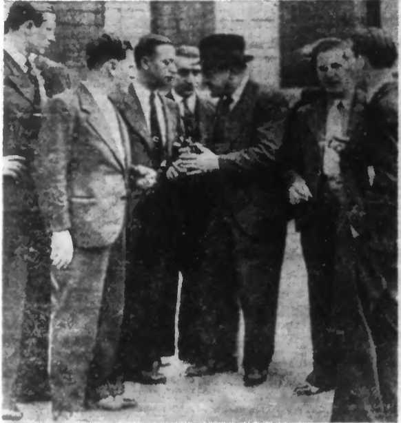
Après son entrevue avec M. CHAUTEUPS, M. FRACHON (en chapeau) s'entretient avec la délégation de l'alimentation, dans la cour de l'Hôtel Matignon.

...a déclaré M. Camille CHAUTEUPS qui a ajouté: « On a pu constater ainsi que la France n'était pas en voie de désunion »