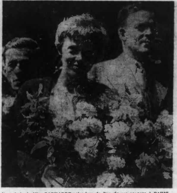
Une photo de Miss EARHARDT prise lors de l'un de ses voyages à PARIS.

Un S. O. S. lancé par l'aviatrice a été capté et onze hydravions sont partis à sa recherche.