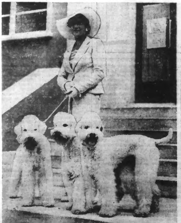
Une manifestation d'élégance « Le Chien de la Parisienne » a eu lieu à Paris. Deux jurys, l'un présidé par la Princesse Amédée de Broglie, l'autre par la Société Centrale Canine devaient décerner les prix. Notre photo montre une concurrente avec ses trois « toujours » particulièrement remarquables.