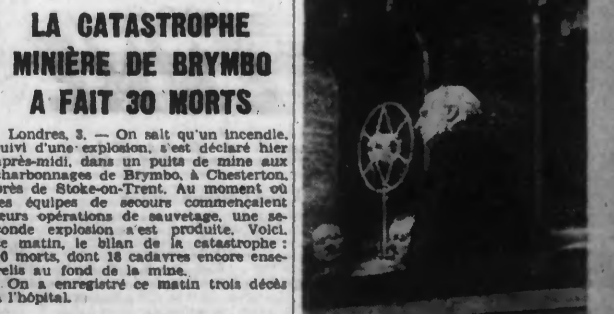
Notre photo montre: M. PAUL BONCOUR prenant la parole au Congrès.