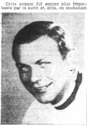
BARTALI la vedette italienne

Les classements après la quatrième étape