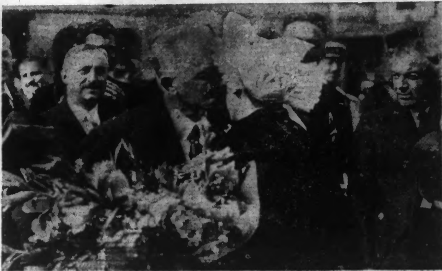
M. Albert LEBRUN est reçu à la porte d'ANGERS par une charmante angevine qui lui offre un bouquet de fleurs, et le Président embrasse de bon cœur la jeune femme.

« Que le malaise dont souffre notre pays s'atténuerait vite si les hommes abandonnaient leurs tendances partisans pour rechercher dans l'intérêt supérieur du pays des raisons de rapprochement » a déclaré le Chef de l'État au cours du discours qu'il a prononcé.