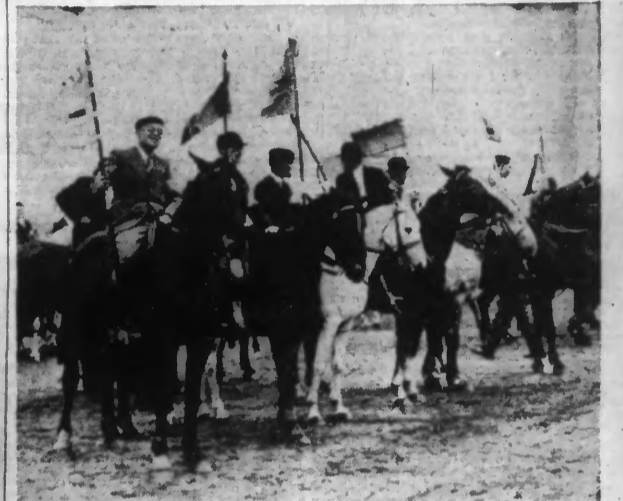
La présentation des étendards d'un groupe de Sociétés Hippiques rurales hier, sur le terrain de l'Hippodrome des Flandres, au CROISÉ-LAROCHE.

CONCOURS D'ATTELAGES, SAUTS D'OBSTACLES, EXERCICES DE VOLTIGE, DE HAUTE ÉCOLE ONT MIS EN RELIEF L'EFFORT DE NOS SOCIÉTÉS HIPPIQUES RURALES