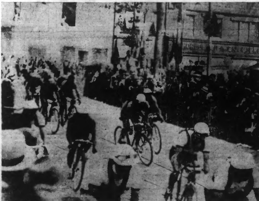
LE GROUPE DE COUREURS DANS LA TRAVERSE DE BESANÇON.

(LIRE LE COMPTE RENDU DE NOTRE ENVOYÉ SPÉCIAL EN « SPORTS »).