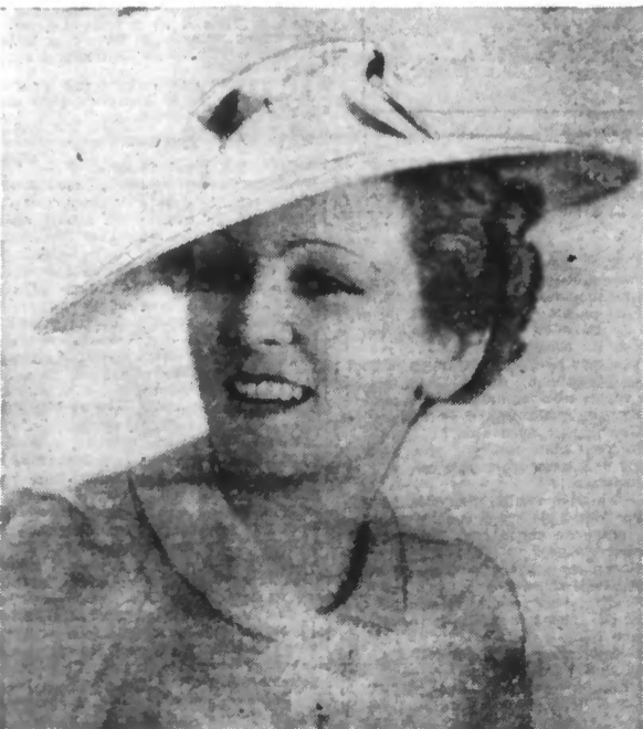
N'est-elle pas folle et bien portée, cette capeline en paille d'Italie ?

Lire en huitième page : NOTRE PAGE FÉMININE