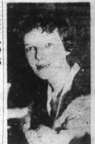
Une photo de la célèbre aviatrice prise il y a peu de temps.