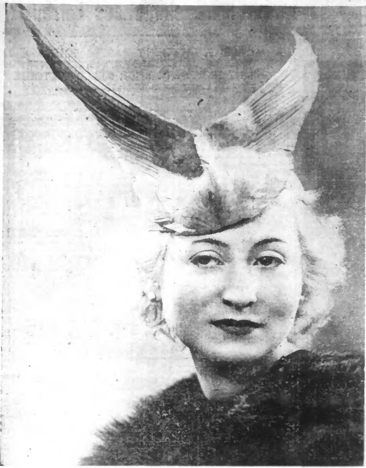
TOQUE garnie d'ailes.