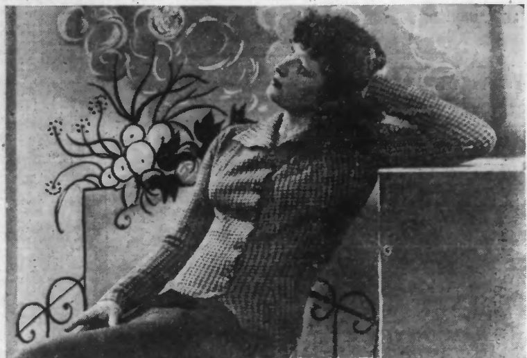
JAQUETTE noir et blanc.