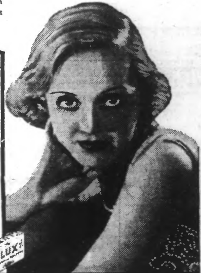
C'EST UNE SPÉCIALITÉ LEVER