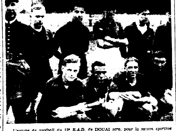
L'équipe de football du 15° R.A.D. de DOUAI sera, pour la saison sportive militante qui va s'ouvrir incessamment, de qualité nettement supérieure à ce qu'elle fut dans le passé.