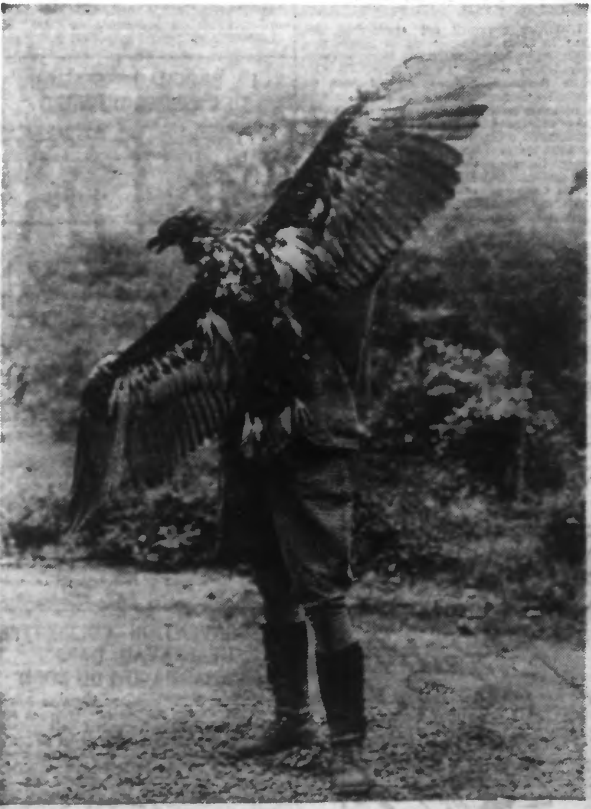
C'est celle d'un aigle de 2 m. 10 d'envergure qui a été abattu à une vingtaine de mètres de hauteur et d'un coup de fusil par un chasseur de Valenciennes (Lure), après un vol impressionnant de l'oiseau de proie.