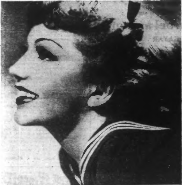
LE SOURIRE DE CLAUDETTE COLBERT.