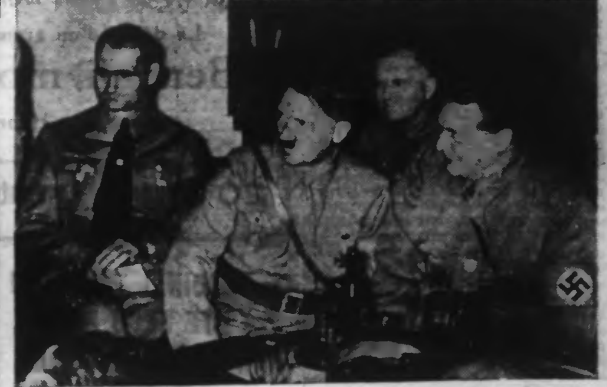
L'Allemagne vient de célébrer l'anniversaire du pacte Lulendorff-Hitler de 1923. Voici les chefs du 3 e Reich, réunis dans la brasserie munichoise, désormais historique, d'où partit l'insurrection. De droite à gauche: Le Général GOERING, le Führer-Chancelier et M. Rudolf HESS.

Le Führer le chargerait de recruter de nouvelles adhésions au protocole anti-Komintern et ses efforts se porteraient en premier lieu sur la Pologne