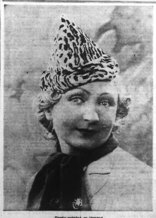
Toque pointée en léopard.

Les actrices qui désirent les patrons-primes des modèles ci-dessus d'auront qu'à nous adresser leur commande accompagnée du montant en timbre-poste. Le prix de chaque patron est de 3 francs. Les envois sont faits franco à domicile. Bien indiquer le numéro du ou des patrons demandés et l'adresse du destinataire. Envoyer votre demande au Service des Patrons du Réveil du Nord n. 120, rue de Paris, Lille.