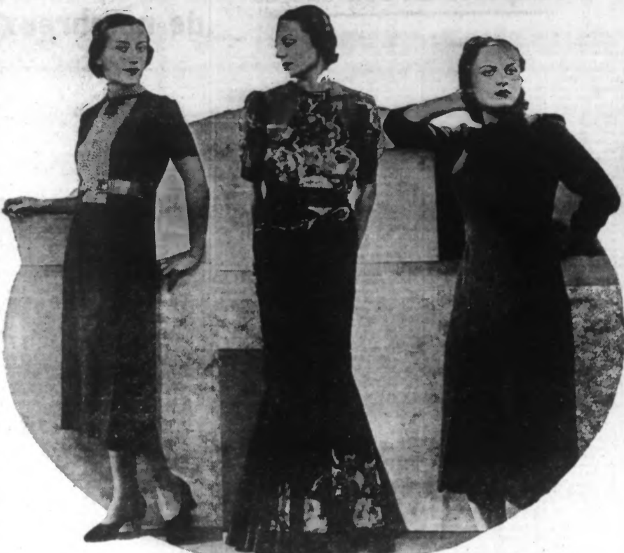
De gauche à droite : Robe simple marine, gilet blanc et bleu. — Robe du soir gros tulle noir, agrémentée de soie fleurie. Robe d'après-midi en lainage fin.