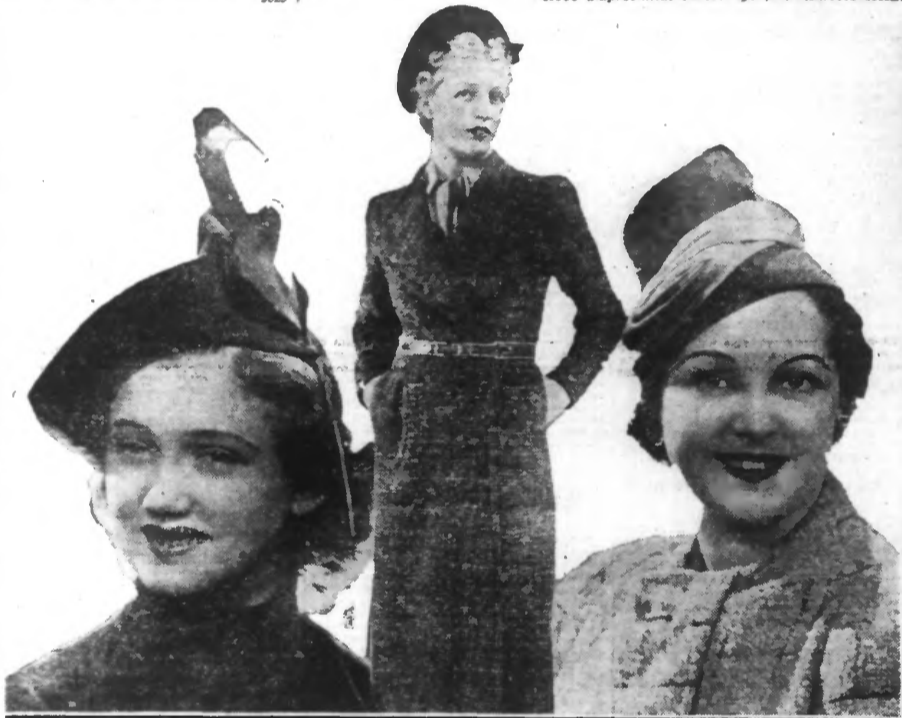
De gauche à droite : Reiseté feutre avec couteau. — Manteau sport, gros lainage mélangé. — Toque feutre velours drapé bleu.

Obes les modistes on revêt, d'une façon très nette, les formes chechias ou les bonnets russes. Il y a une recrudescence des formes coniques ou très pointues.