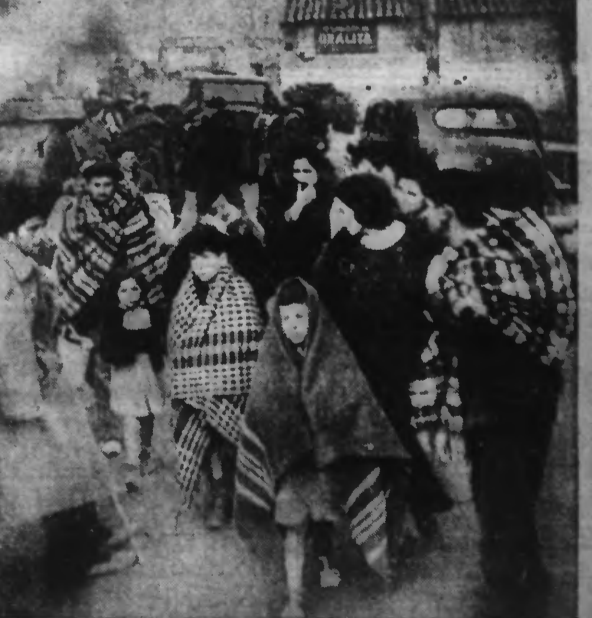
La population civile évacue TERUEL pendant le combat.

SIX MORTS, DIX-NEUF BLESSÉS AU COURS D'UN NOUVEAU BOMBARDEMENT DE MADRID