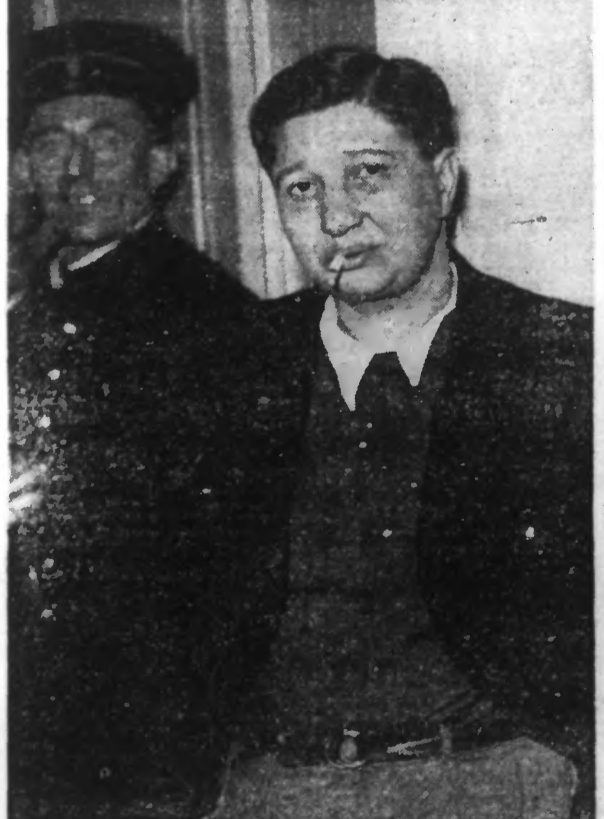
Violette MORRIS photographiée au Commissariat de NEUILLY, peu après son arrestation.

INCULPÉE D'HOMICIDE VOLONTAIRE ELLE A ÉTÉ ÉCROUÉE A LA PRISON DE LA PETITE ROQUETTE