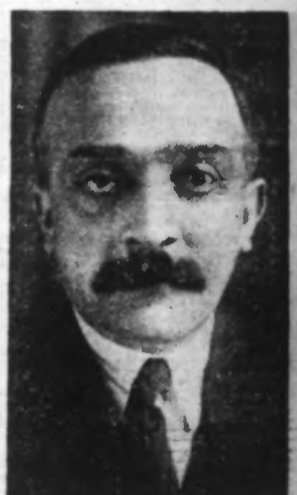
M. QUEUILLE, Ministre des Travaux Publics

L'exonération de la taxe sur les essences L'article 4 bis (exonération des véhicules utilisés à des transports publics de voyageurs ou de marchandises) est mis en discussion.