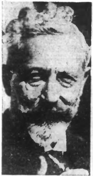
L'ex-Kaiser GUILLAUME II

La petite histoire se plait, en attendant que la grande histoire lui ouvre ses dossiers, à recueillir les phrases malheureuses qui échappent à des hommes publics, parfois dans le feu de l'improvisation, parfois, ce qui est plus grave, en toute connaissance de cause, dans le dessein de faire triompher la thèse qui momentanément domine leur esprit. Ces erreurs, ces « gaffes », si l'on nous permet cette expression familière, sont fréquentes, et tous les gouvernements en ont à leur passif.