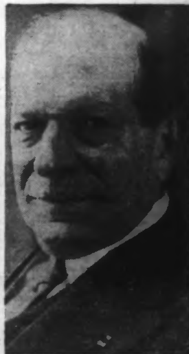
M. MAHIEU, Sénateur du Nord, qui a présidé la séance du Sénat, hier matin.

Il s'engage volontiers à étudier le projet de réorganisation des théâtres nationaux dès le début de la session de 1938. Le budget des Beaux-Arts est adopté. Celui du Commerce est voté sans discussion.