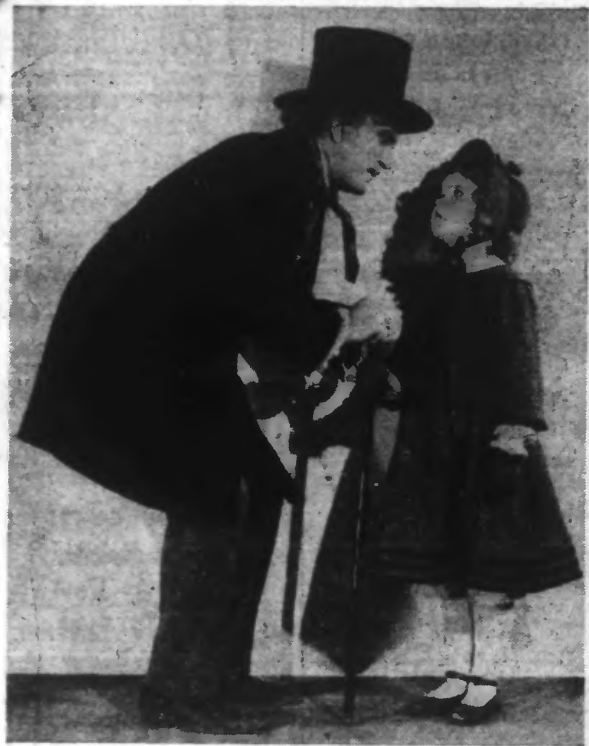
FRANK MORGAN et SHIRLEY TEMPLE dans « Fossettes »

La petite Shirley Temple est universellement reconnue comme la plus célèbre des enfants prodiges de l'écran et du théâtre. Sa carrière fait d'autant plus l'étonnement de ses proches et de ses parents que jamais, dans sa famille, ni de près, ni de loin, personne ne toucha aux choses du spectacle. Son talent est donc né