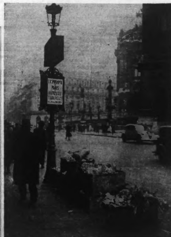
Les « boueux » sont en grève : les boîtes à ordures ménagères restent sur les trottoirs.

LIRE NOTRE INFORMATION EN CINQUIEME PAGE