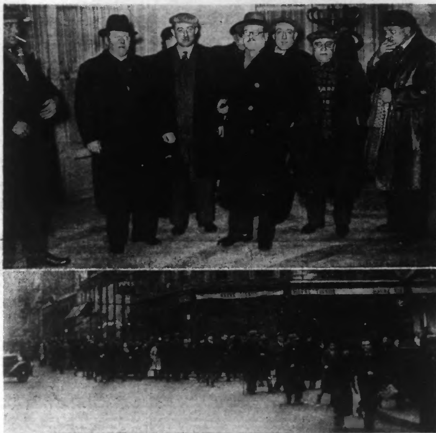
EN HAUT : La délégation ouvrière des Transports qui s'était rendue à la Présidence du Conseil. EN BAS : Le Métro ne fonctionne plus ; les rues étaient, hier matin, animées par une foule d'ouvriers et d'employés qui se rendaient à leur travail « pedibus cum jambis ».

LA POLICE A FAIT EVACUER DES STATIONS DE DISTRIBUTION D'ÉLECTRICITÉ ET PLUSIEURS USINES A GAZ