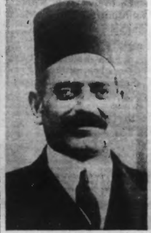
NAHAS PACHA

Nahas Pacha est remplacé par le chef du parti libéral constitutionnel