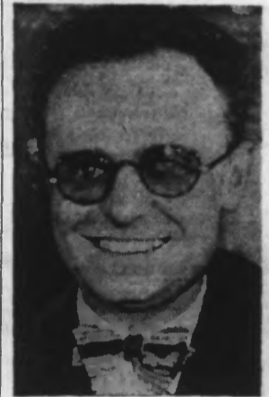
M. Pierre COT, Ministre de l'Air

Paris, 30. — Au cours d'une séance de nuit, qui s'est ouverte, hier, à 21 h. 30, le Sénat a adopté les budgets des Tra-