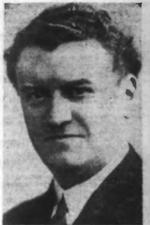
M. PARMENTIER, Député du Nord

En deuxième lecture, le Sénat a adopté un amendement aux termes duquel les majorations et la suppression de la réduction de 10 % ne s'appliqueront qu'aux loyers afférents à la période de jouissance postérieure au 1 er Janvier 1938.