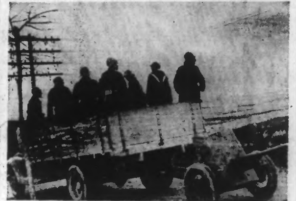
Un camion de troupes républicaines remorquant un canon anti-tank se dirige vers les premières lignes.

Dans la matinée, les troupes du général Aranda avaient occupé la position de la Muela menaçant les lignes gouvernementales