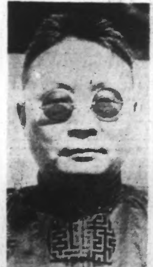
Portrait de M. LO PA HONG qui vient d'être assassiné, non loin de sa résidence, dans l'avenue Dubail, dans la concession française à CHANGHAI.