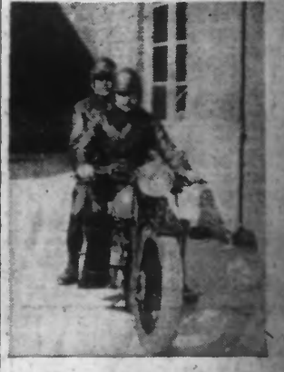
Voici le « coursier » dont devraient être dotées toutes nos gendarmeries : une bonne et solide moto. Ci-dessus, le service motorisé de l'excellente gendarmerie de BERGUES.

A la date du 1 er janvier 1938, le gendarme à cheval aura cessé d'exister. Dans le Nord et le Pas-de-Calais, cette mesure administrative touchera d'innombrables brigades à Dunkerque, Sain-Pol, Bailleul, Hazebrouck, Armentières.