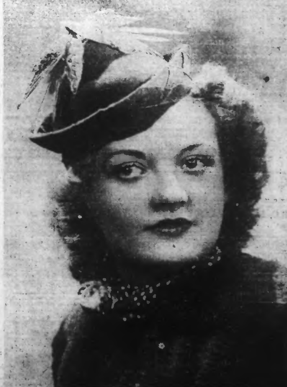
petit chapeau, bord tressé, garni oiseaux.