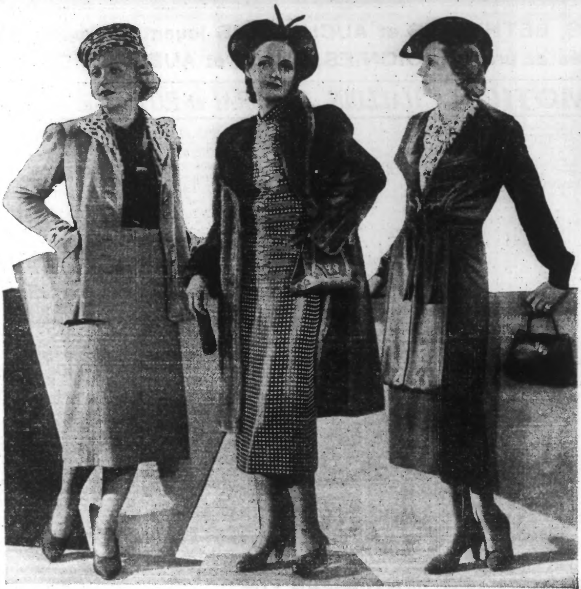
De gauche à droite : Ensemble beige garni ocellé, blouse marron. — Robe de soir à pois blancs, trois-quarts fourrure. — Robe manteau noir, garniture satin.