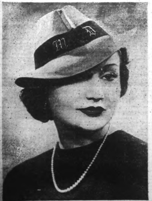
Sport feutre, gros grain avec initiales brodées.

A droite — Parure en crêpe Pompadour garni d'une application de tissu uni. Garniture de nervures à la chemise et à la culotte.