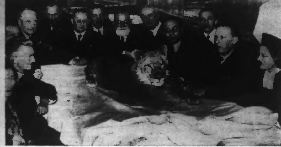
A MILAN, un dîner d'adieu fut offert au Directeur du Zoo qui partait pour une chasse aux fauves en AFRIQUE. Ses amis eurent l'idée originale d'inviter à leur festin le roi du désert.