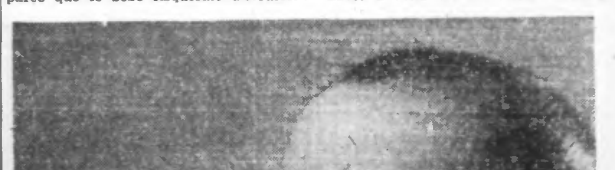
Les tetines de caoutchouc doivent être lavées, retournées et brossées chaque fois qu'elles servent ; elles seront conservées à sec.

Couchez toujours l'enfant tantôt sur un côté, tantôt sur l'autre, mais jamais sur le dos. Ceci pour deux raisons : d'abord parce que les os très mous du crâne se modeleront également, ensuite parce que le bébé risquerait d'étouffer.