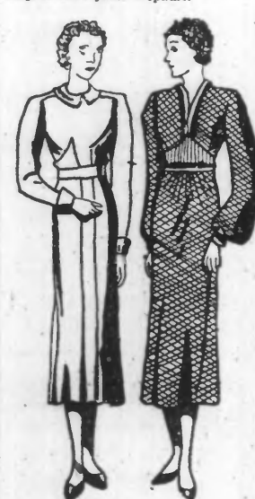
N° 6874 Métrage : 2 m 60 en 140 N° 6875 Métrage : 2 m 10 en 140

A gauche. — Robe en linage ornée de découpes au corsage se terminant en plus plats sur le milieu devant. Manches longues avec patte d'épaule.