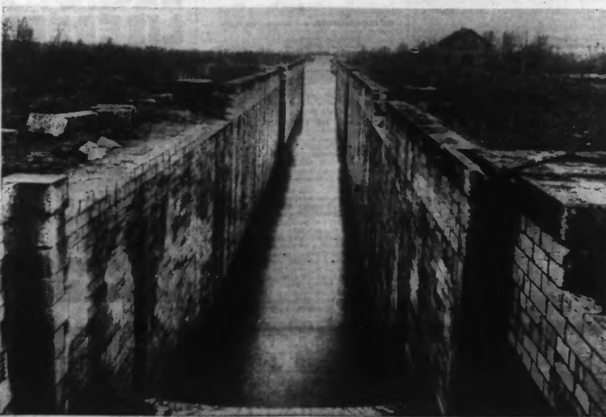
UNE VUE DU CANAL DU NORD (L'ÉCLUSE DE PALLUEL-ARLEUX).

« IL FAUT L'ACHEVER OU LE NIVELER », DÉCLARA LA FÉDÉRATION DES PORTS ET DOCKS, LORS DE SON CONGRÈS NATIONAL DE NANTES