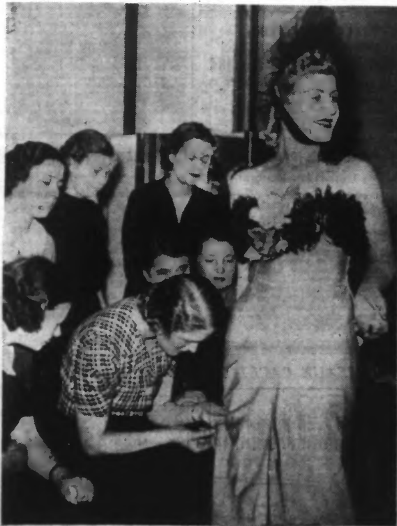
C'est une heureuse innovation d'une grande maison de couture de Paris que de faire revivre, pour les ouvrières qui les ont exécutées, les robes qui sont destinées à la clientèle. Pendant le défilé, les jeunes ouvrières examinent avec intérêt les modèles qui leur sont présentés.

Lire en huitième page : notre « PAGE FÉMININE ».