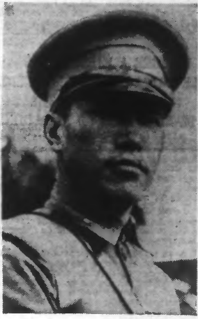
Le Maréchal TCHANG KAI CHEK

UN HYDRAVION ANGLAIS A ESSUYÉ LE FEU DES NAVIRES NIPPONS AU SUD DE HONG KONG