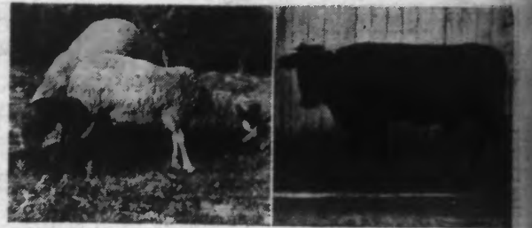
Les moutons reniflent la nourriture et s'en vont plus loin, sans y toucher. La génisse devient méchante et regarde les gens d'un œil bien sombre...

HISTOIRES FANTASTIQUES ET PÈLERINAGES ÉTONNANTS AU COUVENT SAINT-SIXTE PRÈS DE ROUSBRUGGE (BELGIQUE) PRESQUE A CHEVAL SUR LA FRONTIÈRE