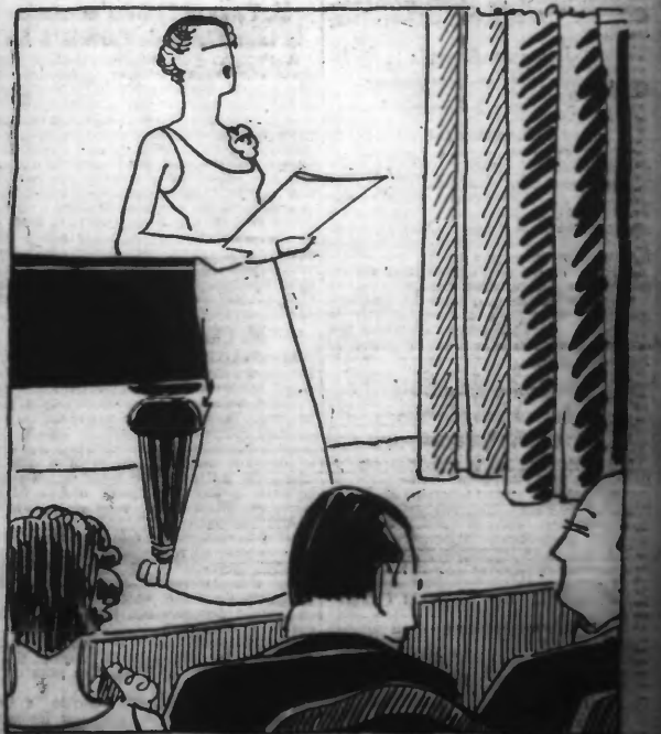
« Elle chante pour « l'œuvre des Louvres »... — J'ai l'impression que « sa » robe est déjà en « vacances » !! »