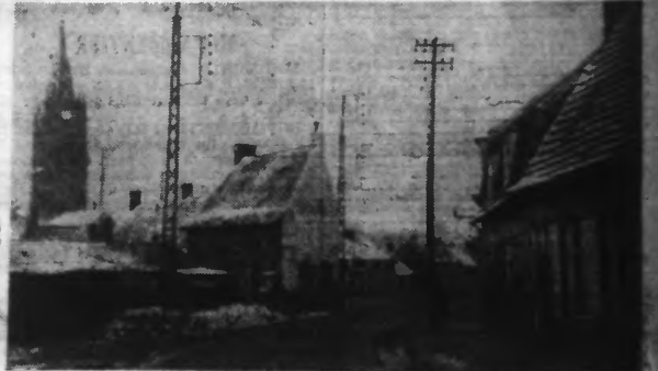
La fièvre aphteuse a continué ses assauts en Flandre agricole et maritime. Et les éleveurs sont bien inquiets... — Une vue d'une commune de Flandre.

DISCIPLINÉS, LES MÉTALLURGISTES SE RANGENT A L'AVIS DE LEURS DIRIGEANTS SYNDICAUX