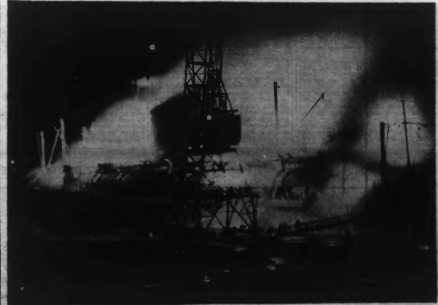
Le navire en feu dans le port, alors que les pompiers luttent contre l'incendie.

Le transatlantique sera-t-il réparable ou doit-il être considéré comme totalement perdu ?