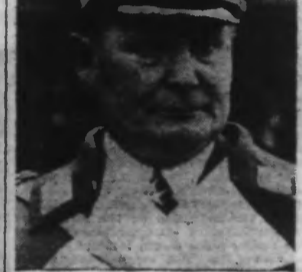
Le Maréchal GÖERING

Le journal ajoute que si le Maréchal Goering lui disait que les rapports entre l'Allemagne et la Tchécoslovaquie, au sujet de ces deux pays, l'ambassadeur aurait pour instruction de lui déclarer que le Gouvernement britannique ne peut accepter cette façon de voir et qu'au contraire, au cas où un acte de violence serait commis par l'Allemagne à l'égard de la Tchécoslovaquie, la Grande-Bretagne, pas plus que la France ne pourrait demeurer immobile.