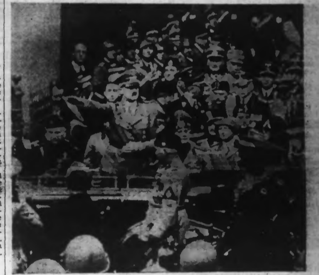
Le Führer et le Duce sortent du Panthéon après la visite du tombeau des Rois.

LES POURPARLERS, DONT LA QUESTION TCHÉCOSLOVAQUE ET LE PROBLÈME COLONIAL CONSTITUENT LA PRÉFACE INDISPENSABLE, SE POURSUIVENT ENTRE LE CHANCELIER ET LE DUCE