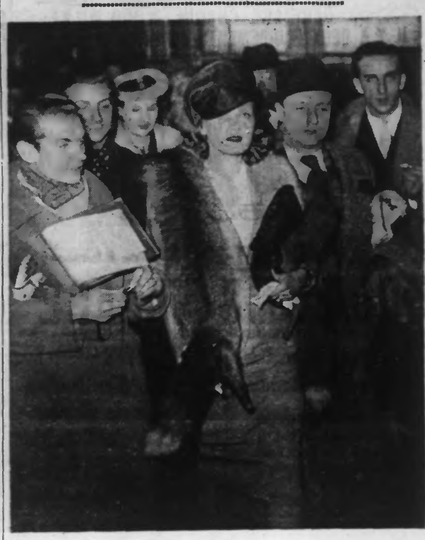
La star : l'écran est arrivé récemment en France, par le « Queen Mary » et a gagné aussitôt Paris. La voici à la gare St-Lazare. On dit qu'elle ne retournerait plus à Hollywood.