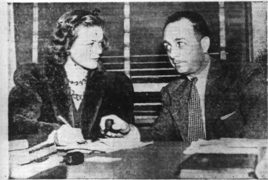
Los Angeles. — La célèbre actrice française, Simone SIMON, a été esroquée par son ancienne secrétaire de sommes importantes. Elle a déposé une plainte contre celle-ci. La voici, signant sa déposition chez le juge d'instruction.