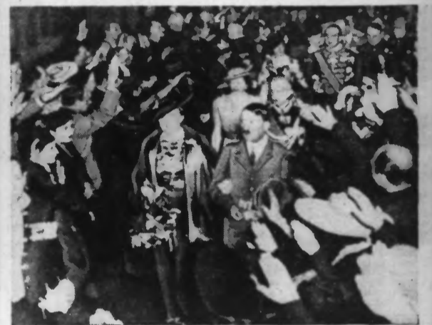
Le Führer a assisté dans les jardins du Capitole de Rome, à une fête musicale et folklorique. Salué par les invités, la Reine d'Italie et le Chancelier du Reich (qui lui donne le bras), arrive au Capitole.

Rome, 8. — Sur la plage méditerranéenne de Furbara, le Roi, le Führer et le Duce ont assisté ce matin à de grandes manœuvres aériennes. On avait construit la ville entière pour reconstruire le mouvement d'un port au début d'une guerre avec des bataillons entiers prêts à embarquer. Des vagues d'assaut d'avions accoururent de tous les points de l'horizon et procédèrent à un bombardement intense d'une régularité terrifiante. Selon la taille des appareils, ils déversèrent des charges de quatre mille à dix mille kilos. Une centaine d'avions de chasse se livrèrent ensuite à des simulacres de combats acrobatiques : le tout se termina par un défilé de 400 avions échelonnés en hauteur.