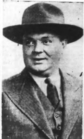
M. SPAAK Ministre des Affaires étrangères de Belgique.

Bruxelles, 8. — M. Spaak, ministre des Affaires étrangères, et M. de Smeed, ministre des Affaires économiques, ont quitté Bruxelles aujourd'hui pour Paris, en vue d'examiner avec le Gouvernement français les moyens propres à éviter les inconvénients qui pourraient résulter pour la Belgique de la dévaluation monétaire française.