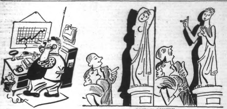
FAUX NUMERO — Non, Monsieur, je ne suis pas votre petite poulette blonde. ETERNEL FEMININ — Le Guide. — Cette statue, madame, est âgée de vingt siècles. Le Statue. — Pardon, de 1974 ans seulement.