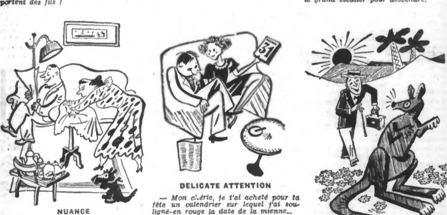
NUANCE — Ah traitement, tous les hommes sont des imbeciles ! — Pardon, il y a aussi les célibataires ! DELICATE ATTENTION — Mon chéri, je t'ai acheté pour ta fête un calendrier sur lequel j'ai souligné en rouge la date de la mienne...