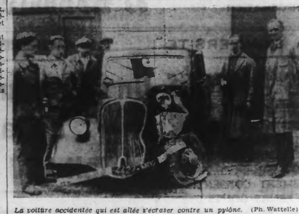
La voiture accidentée qui est allée s'écraser contre un pylône.