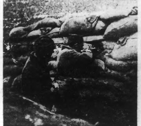
Une tranchée dans laquelle les gouvernementaux tirent sur les rebelles.

Leurs adversaires annoncent qu'ils se sont emparés par surprise d'importants points stratégiques, au Nord de la route de Linarès de Mora et qu'ils ont abattu quatorze avions gouvernementaux