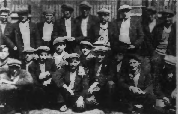
Le piquet de grève de vant l'entrée du puits.

UN ACCORD ÉTANT INTERVENU DANS LA JOURNÉE LE TRAVAIL PRENDRA NORMALEMENT CE MATIN DANS TOUTE LA CONCESSION