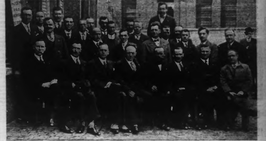
LES MEMBRES DU GROUPE DES A. A. O. DE RONCO.

Le Groupe des A.A.O. de Ronco a fêté dimanche dernier, avec grand succès, le dixième anniversaire de sa fondation.