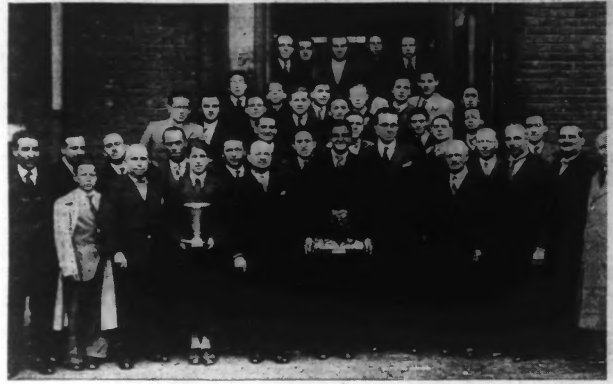
Nous avons donné, hier, le compte rendu de la manifestation organisée à l'occasion de la remise du Challenge Georges Moulin à l'Iris-Club de Lambart et au Lycée de Douai.

Entrées du 30 mai à 4 juin. — Laine peignée 887.143 k.; filés 78.119 k.; blouses et lainés diverses 180.927 k.; cotons 31.187 k. Nombre lots 647; totaux quotidiens 877.396 k.