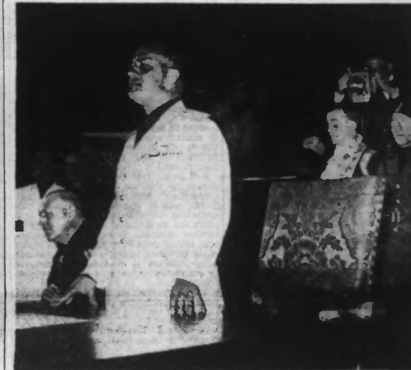
Le Comte CIANO discutant.

Le comte Ciano, ministre des Affaires étrangères d'Italie, a eu, hier, avec lord Perth, ambassadeur de Grande-Bretagne, un entretien qui a suscité un vif intérêt dans les milieux diplomatiques de Rome.