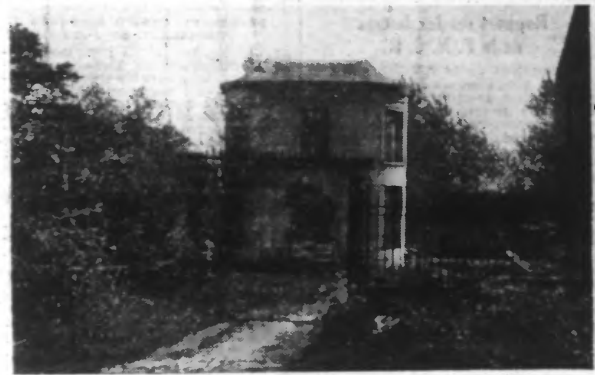
LES RUINES DE NEDONCHEL.

Allons à Jolimetz, village sis dans la banlieue du Quesnoy en bordure de la Forêt de Mormai où fleurit le commerce des fruits, du cidre et du beurre. C'est là que dans le calme acreste se dressent les ruines de l'ancien château des Barons de Nedonchel.