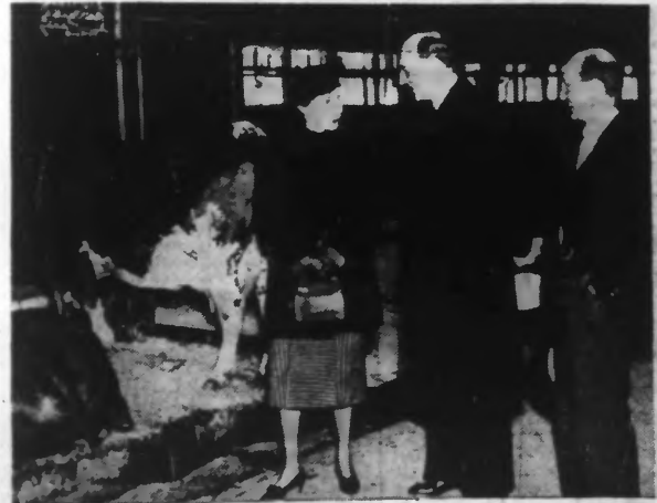
Voici un curieux document pris lors du séjour en Suède, du Colonel BECK. De gauche à droite : Mme et M. BECK, Ministre des Affaires étrangères de Pologne, et M. SANDLER, Ministre des Affaires étrangères de Suède, visitant une importante ferme.

Lire en huitième page : Le « RÉVEIL AGRICOLE ».