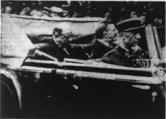
MM. DALADIER et HERRIOT, Maire de LYON, après l'inauguration du Monument, en voiture dans les rues de Lyon.

...a déclaré à Lyon, M. Edouard Daladier qui a souligné également « que pour mener à bien cette tâche, d'autres nations sont animées d'une résolution identique à la nôtre ».