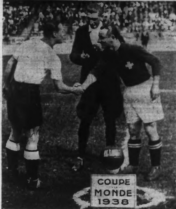
Lire en « Sports » les relations des matches ainsi que toutes autres sur les divers réunions athlétiques.

Comme chacun le sait, le match inaugural de ce magnifique tournoi eut lieu samedi à Paris, entre les teams d'Allemagne et de Suisse. Les adversaires ne purent se départager et se rencontreront à nouveau jeudi prochain. Nos clichés représentent, en haut, une phase de cette partie ; en bas, les deux capitaines se serrant la main, en présence de l'arbitre, avant le coup d'envoi.