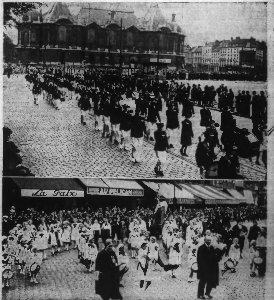
EN HAUT : Le cortège des musiques enjantines traverse la place de la République. — EN BAS : Il partient Grand-Place. Au premier plan, on voit la Société lilloise bien connue : La Symphonie « BEBE-ORCHESTRE ».

AUJOURD'HUI, UN GRAND CORTÈGE CARNAVALESQUE DÉPLOIERA SA COULEUR ET RÉPANDRA SA GAÏÉTÉ DANS LA CITÉ