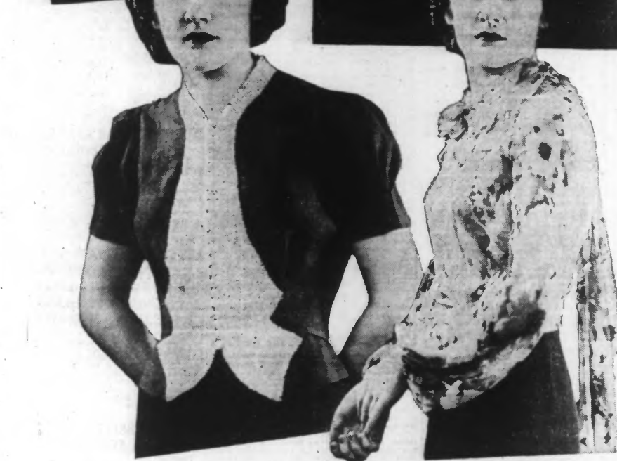
De gauche à droite, en haut : Blouse blanche garnie plissée et Valenciennes. — Blouse brodée en tulle.