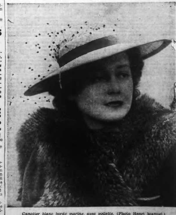
Canotier blanc borde marine, avec voilette.

Inscrivez vos nom et adresse sur un papier, joignez-y trois timbres à 0 fr. 45 et envoyez le tout aux Filatures des 3 Savoies (service 747) à Roubaix (Nord). Vous recevrez par retour du courrier un précieux recueil de 24 points de tricot, d'une présentation réellement très pratique. Un magnifique système de pliage permet de trouver immédiatement la description du point cherché sans avoir à feuilleter. Chaque description de point est accompagnée d'un croquis très clair permettant de suivre facilement l'exécution.