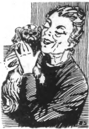
Chaque d'elles possède un petit Kiki...

En ce moment, les Pouvoirs publics, les chemins de fer, les syndicats d'initiative, les agences de voyage et les hôteliers multiplient leurs efforts pour développer le tourisme en France et attirer chez nous le plus grand nombre de voyageurs possibles.