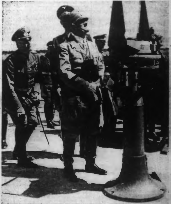
Le Chancelier HITLER a assisté à d'importants exercices de l'Armée de l'Air allemande. Le voici suivant les évolutions des avions.

IL ÉTAIT PARTI A VIENNE POUR RÉGLER LES AFFAIRES DU PARTI NAZI AUTRICHIEN