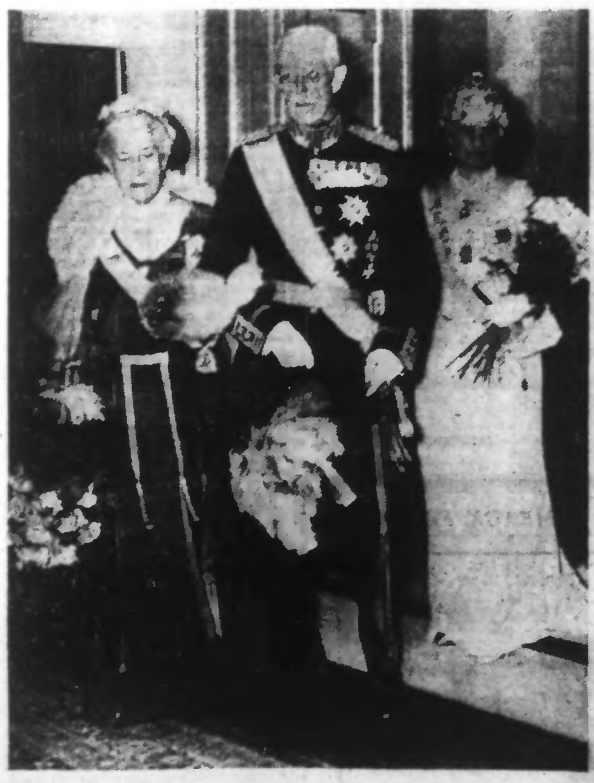
S.M. GUSTAVE V de Suède a présidé à STOCKHOLM le Bal de l'Amarante. Le Souverain arrivant au bal en compagnie de la Princesse HILDA DE BADE (à gauche).