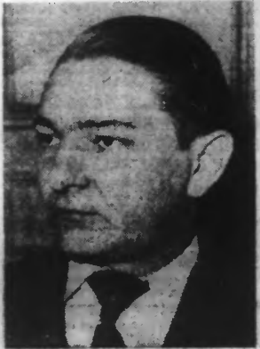
M. TIXIER-VIGNANCOURT