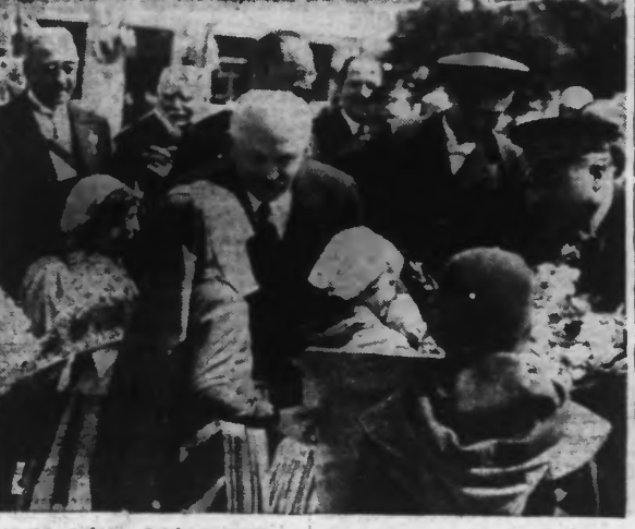
A son arrivée le Chef de l'Etat est accueilli par des petits enfants en costume régional.

« UNE IMPÉRIEUSE NÉCESSITÉ S'IMPOSE, CELLE D'UN TRAVAIL RÉGULIER, PRODUCTIF, PROLONGÉ ; JE VOUDRAIS QUE CET APPEL FUT ENTENDU DE TOUS », A DÉCLARÉ LE CHEF DE L'ÉTAT DANS LE DISCOURS QU'IL A PRONONCÉ