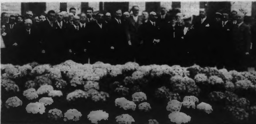
LES AUTORITÉS LEVANT UN MAGNIFIQUE PARTERRE D'HORTENSIAS.

Voici que des roses en abondance, des roses de toutes couleurs, de tous parfums, de toutes formes, garnissent à nouveau de leur splendeur magnifique l'immense nef du Palais-Rameau. Des Pivoines odorantes, des Hortensias monstrueux, des Orchidées rares, des Lys virginaux, des Poincettes délicates, des Ajoncs rustiques, et des Rhododendrons étrangers, des Gladiolus somptueux, des Céléstins décapités, même des Cactées rébarbatifs et surprenants, leurs font cortège.