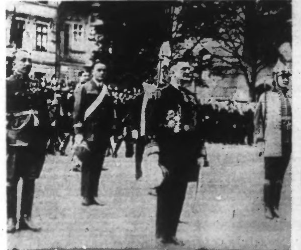
Le Régent HORTHY, assistant à une cérémonie officielle.

Budapest, 18. — L'amiral Horthy, régent de Hongrie, fête aujourd'hui son 70 e anniversaire. Le pays tout entier a organisé des fêtes afin de manifester ses sentiments loyaux et sincères envers le chef de l'Etat qui constitue depuis plus de dix-huit ans déjà, la garantie suprême de l'ordre intérieur et de l'indépendance extérieure du pays.