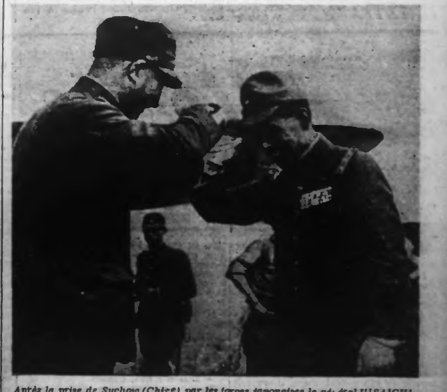
Après la prise de Suchow (Chine) par les forces japonaises le général HATA (à gauche) Commandant en chef des forces japonaises en Chine du Nord, salue le Général SHUNREKU HATA, Commandant en chef des forces japonaises en Chine Centrale. Les deux généraux semblent fort satisfaits de leur victoire.

Berlin aurait menacé Hankéou Une machine infernale a été découverte dans la concession française de Tien Tsin