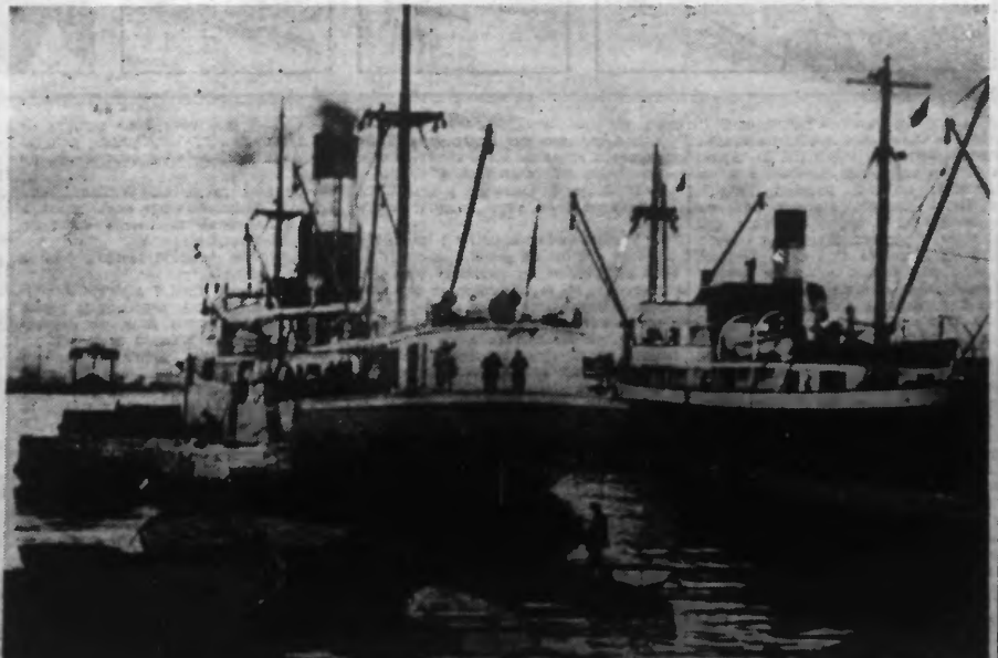
Une vue de Del Grao, le port de Valence, où plusieurs navires anglais ont été bombardés et coulés par l'aviation franquiste.

L'ÉTAT MAJOR ITALIEN CONSIDÈRE, EN EFFET, COMME ACQUISE LA VICTOIRE DE FRANCO A CONDITION QUE LE CONTRÔLE SOIT RENFORCÉ AUX FRONTIÈRES GOUVERNEMENTALES