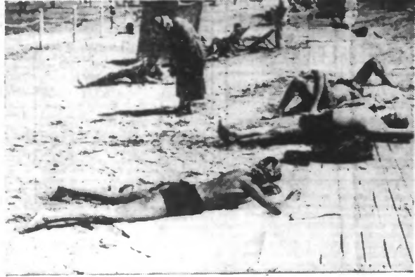
Les bains de soleil peuvent être très dangereux ou très salutaires.

toujours avec modération, sans jamais atteindre la fatigue. Les bains de mer sont excellents pour la santé, encore ne conviennent-ils pas à tous les tempéraments. Les rhumatisants, les vieillards, les nerveux doivent s'en abstenir; aussi, à ce sujet, est-il sage de demander l'avis de son médecin. Les bains de mer sont hygiéniques à la condition de les prendre courts, ils ne