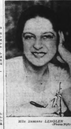
Mlle Suzanne LENGLEN