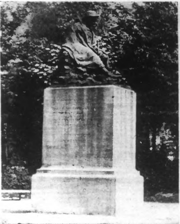
Le Monument à Auguste ANGELLIER, à Lille.