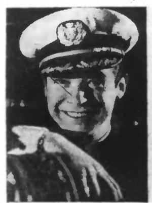
Fernand GRAVEY dans son premier film américain « LE ROI ET LA FIGURANTE »