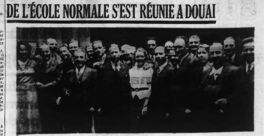
LES NORMALIENS DE 1919. La première promotion d'après-guerre de Douai se réunit à Douai pour la cérémonie de distribution de diplômes.