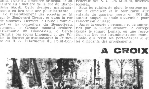
A Croix, un cortège qui s'était formé à la Makellerie se déroula par les rues de la ville et du hameau furent rendus au cimetière militaire...