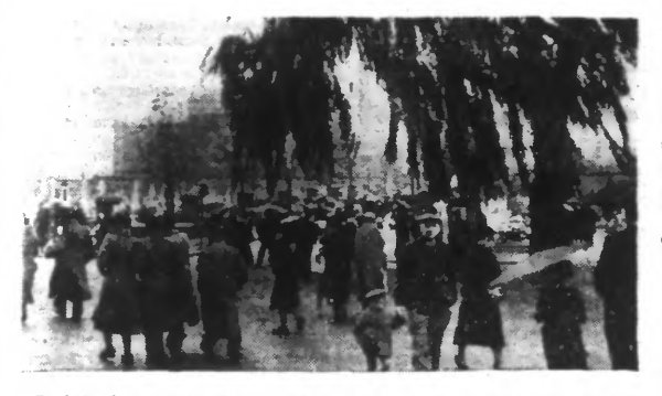
A Roubaix, la manifestation traditionnelle se déroule le dimanche précédant la Toussaint...