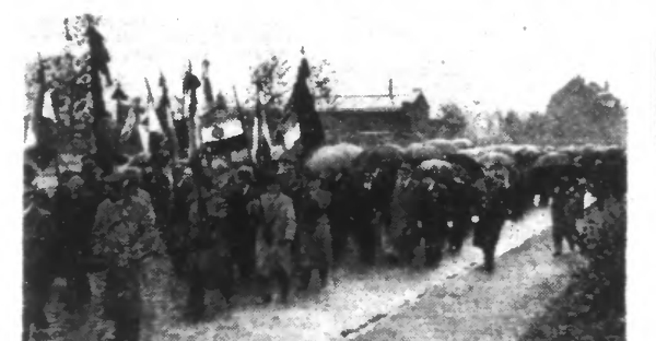
Derrière les drapeaux et la municipalité, les sociétés se dirigent en un long cortège vers le cimetière du Blanc-Seaux...